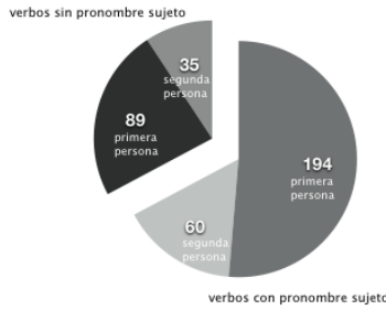
Gráfico 1: relación entre verbos con pronombres sujeto y verbos sin ellos

Los verbos conjugados en primera persona muestran una tendencia general levemente más alta que los conjugados en segunda persona a presentar pronombres sujeto: 68,6% frente a 63,2%. Para ambas conjugaciones, sin embargo, la presencia de los pronombres sujeto es abundante.